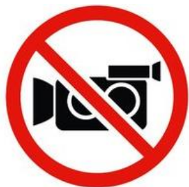
ФОТО-/ВИДЕОФИКСАЦИЯ НА ВСЕЙ ТЕРРИТОРИИ ПЛОЩАДКИ, БЕЗ СООТВЕТСТВУЮЩЕГО РАЗРЕШЕНИЯ РУКОВОДСТВА ПЛОЩАДКИ